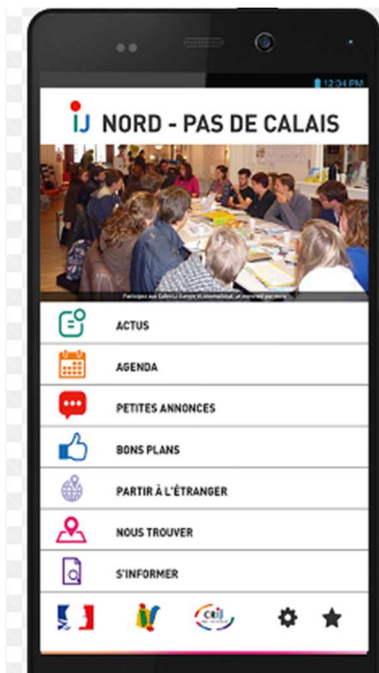
Figure 1 Application IJ, Nord-Pas-De-Calais