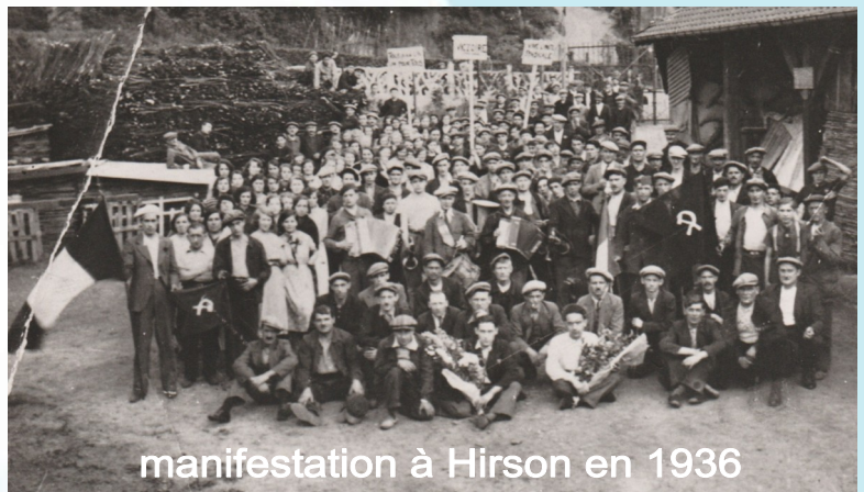
manifestation à Hirson en 1936

En 1937, le gouvernement du Front Populaire dirigé par Léon Blum vote la création de la SNCF et instaure des billets populaires de congés payés à tarif réduit.